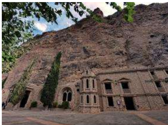
Santurio Virgen de la Esperanza, Calasparra