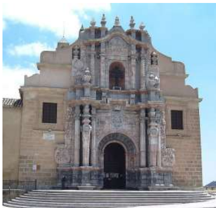
Basilica de la Vera Cruz