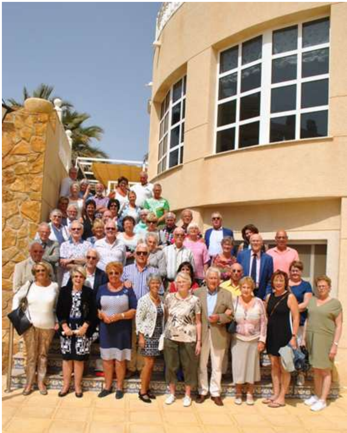
Kerk zijn we SAMEN – Guardamar, 22 april 2018