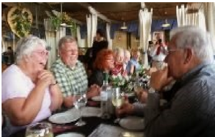
Samen gemeente zijn